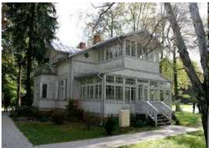
Dom pp. Lipszyców w Ostrówku